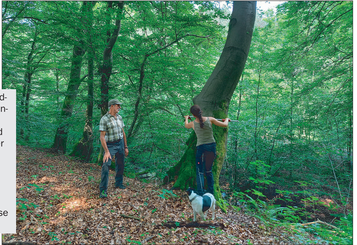
Hotspot-Inventur: Aufnahme von Daten im Wald zur Planung von Verjüngungs-, Pflege- und Hiebsmaßnahmen.