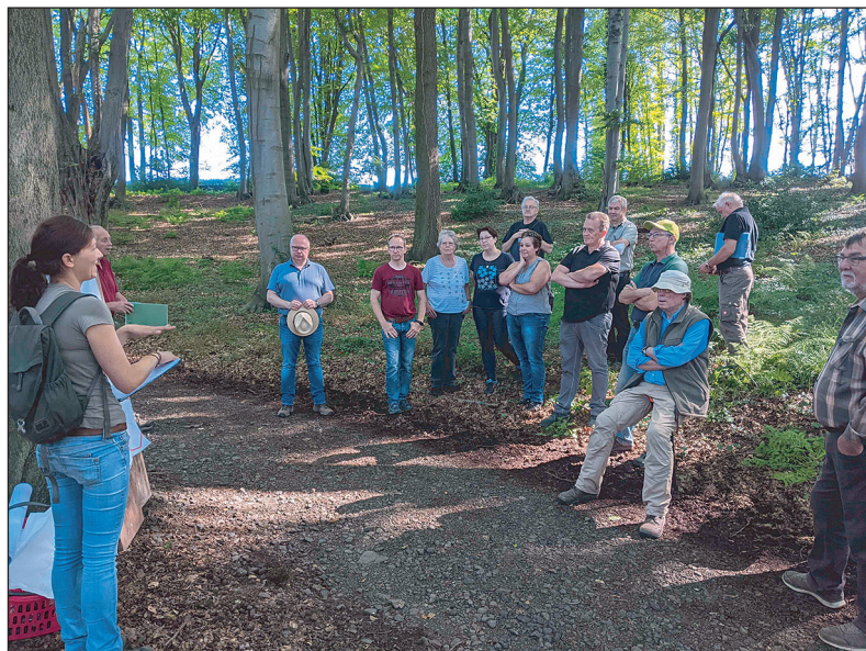
Diskussion mit Waldbesitzenden - Vorstellung von Art und Dringlichkeit waldbaulicher Eingriffe sowie den Möglichkeiten, mit Baumartenvielfalt Klimastabilität zu erreichen.

■ Die Katasterdaten sind häufig veraltet oder unvollständig, d.h. als Besitzer stehen häufig bereits verstorbene Personen im Kataster, die Anschriften sind nicht aktuell. Dazu kommt, dass keine Telefonnummern hinterlegt sind. Dies bedingt eine