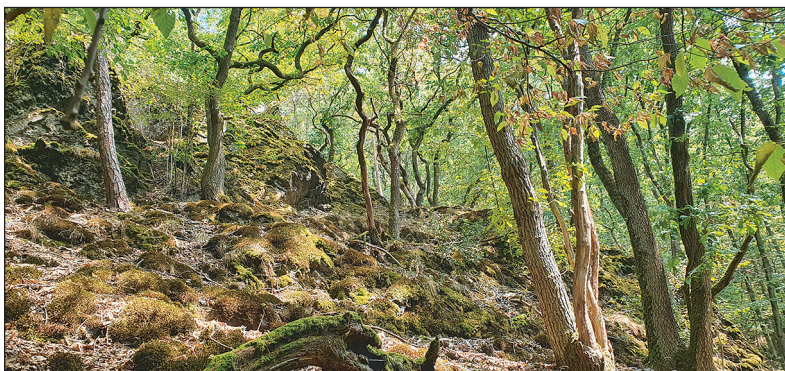
Eichen-Stockausschlagwald am Hang: vorsichtige Nutzungen stabilisieren die steilen Hänge und erhalten den hohen Naturschutzwert.

Angestrebt werden nachfolgende Ziele: Priorität hat der Aufbau klimastabiler Wälder. Diese zeichnen sich durch strukturreiche Laubmischwälder, stufigen Aufbau und hoher Baumartenvielfalt aus. Und gleichzeitig hat aus Gründen der Wirtschaftlichkeit das Einbringen standortgerechter Nadel-