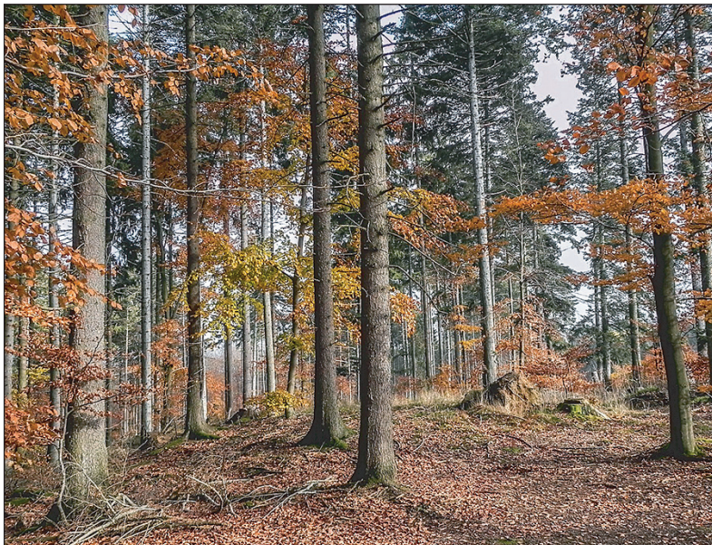
Buchen-Tannen-Mischwälder widerstehen Trockenstress besser als reine Buchenwälder.

Eine digitale Plattform für den Wissens- und Erfahrungsaustausch rund um den Wald bietet die Arbeitsgemeinschaft Deutscher Waldbesitzerverbände, AGDW - Die Waldeigentümer. Der Online-Dienst ist laut Angaben des Dachverbandes angelehnt an die Enzyklopädie „Wikipedia“. Er bietet laut AGDW vor allem Wissenstransfer und ein Diskussionsforum. Waldbesitzende, Zusammenschlüsse, Wissenschaftler und Experten profitieren vom Wissen anderer und brächten ihr eigenes Wissen ein. Artikel würden von der Online-Community erstellt und bearbeitet. Zudem würden Diskussionen zu forstlichen und forstpolitischen Themen geführt. Experten könnten Online-Fachvorträge anbieten, an denen jeder teilnehmen könne. Ein Meldesystem erfasse darüber hinaus Schäden im Wald und trage zum bundesweiten Monitoring bei. Im Fokus stünden die Klimaanpassung der Wälder sowie Praxistipps bei der Begründung neuer Waldbestände, darüber hinaus Empfehlungen zur Prävention und Abwehr von Schädlingsbefall sowie Hilfestellungen für Förderanträge in den einzelnen Bundesländern. Die Plattform ist im Internet unter www.wald-wiki.de zu finden. ag