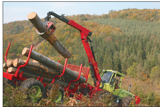
Im Rahmen des Projekts entstand der Wunsch, eine dauerhafte und gemeinschaftliche Waldbewirtschaftung zu organisieren.

Im Rahmen des Projekts entstand der Wunsch, eine dauerhafte und gemeinschaftliche Waldbewirtschaftung zu organisieren. Die räumliche Ausdehnung orientiert sich an einem Eigenjagdbezirk mit ca. 110 ha Größe und rund 150 Eigentümern. Die Bewirtschaftung würde gemeinschaftlich durch eine Waldbaugemeinschaft erfolgen. Dadurch