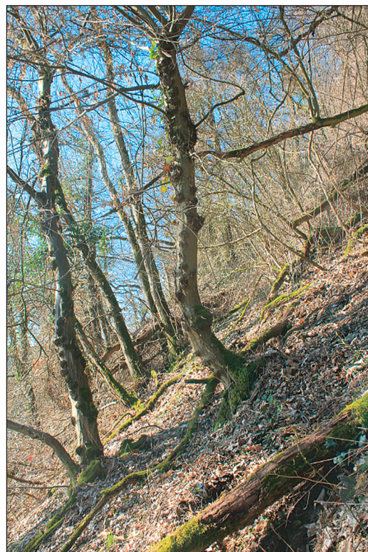
Die Bewirtschaftung von Stockausschlagwäldern mit Hangschutzfunktion erfordert viel waldbautechnisches Know-how. Der Klimawandel ist zusätzlich eine besondere Herausforderung. Der rechte Baum weist wiederum typischen Säbelwuchs auf.

• Auf ihnen werden im Frühjahr 2021 Demonstrationsflächen angelegt, auf denen Maßnahmen aus dem Handlungsleitfaden umgesetzt und evaluiert werden. Direkt neben den Demonstrationsflächen werden unbehandelte Monitoringflächen angelegt. Diese bleiben unbewirtschaftet und dienen als Referenzflächen.