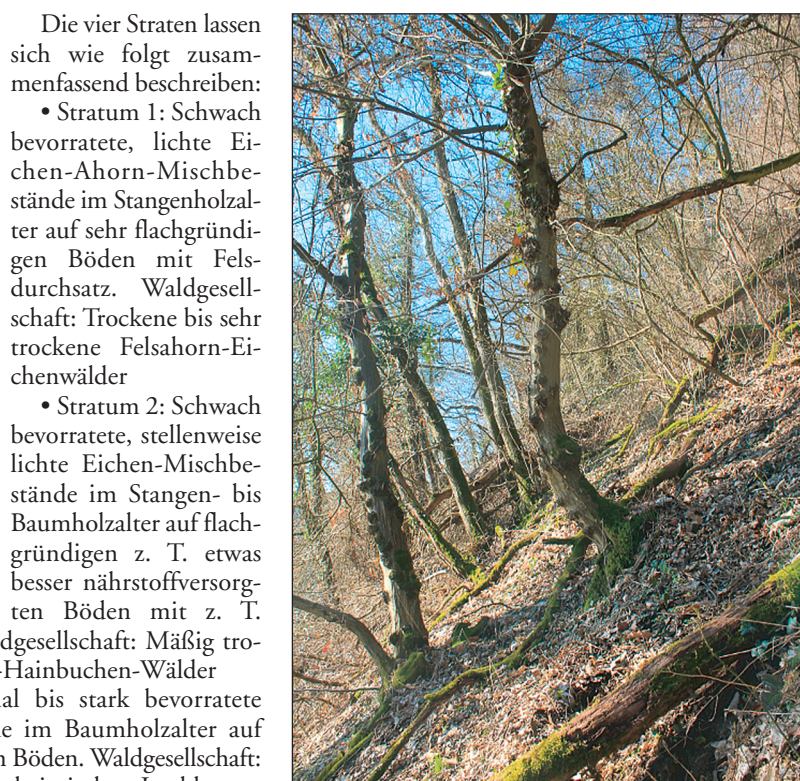
Die Bewirtschaftung von Stockausschlagwäldern mit Hangschutzfunktion erfordert viel waldbautechnisches Know-how. Der Klimawandel ist zusätzlich eine besondere Herausforderung. Der rechte Baum weist wiederum typischen Säbelwuchs auf.

Aus diesen Wäldern wurden dann typische Vertreter jedes Stratums ausgewählt, die im Projekt in mehrfacher Hinsicht genutzt wurden: • Hier wurden Parameter für das Wachstum der Bäume für die Simulationen der Professur für Forstökonomie und Forstplanung gewonnen. • An ihnen wurden beispielhafte Behandlungsmöglichkeiten in mehreren Expertenworkshops diskutiert und analysiert. • Auf ihnen werden im Frühjahr 2021 Demonstrationsflächen angelegt, auf denen Maßnahmen aus dem Handlungsleitfaden umgesetzt und evaluiert werden. Direkt neben den Demonstrationsflächen werden unbehandelte Monitoringflächen angelegt. Diese bleiben unbewirtschaftet und dienen als Referenzflächen.