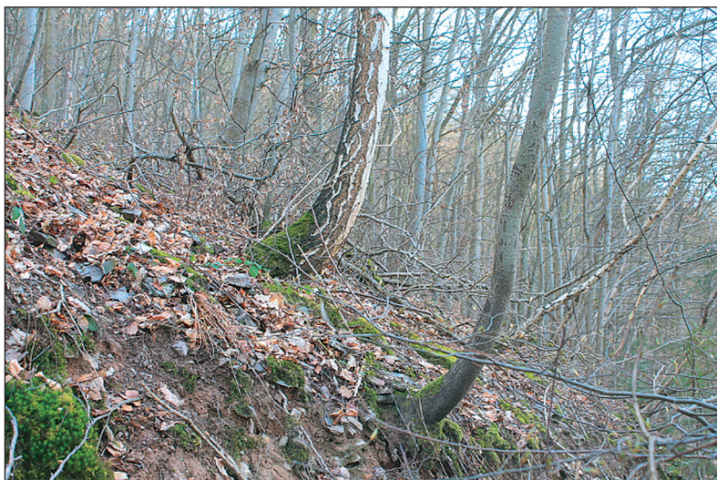
Säbelartig wachsende Bäume sind ein Indikator dafür, dass sich der Hang, auf dem sie wachsen, bewegt.

Zudem wurde eine Mindestgröße dieser Waldflächen von 1 ha festgelegt, alle kleineren Waldflächen wurden aus der Auswahl entfernt.