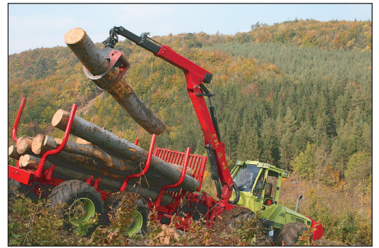
Im Rahmen des Projekts entstand der Wunsch, eine dauerhafte und gemeinschaftliche Waldbewirtschaftung zu organisieren.

Im Rahmen des Projekts entstand der Wunsch, eine dauerhafte und gemeinschaftliche Waldbewirtschaftung zu organisieren. Die räumliche Ausdehnung orientiert sich an einem Eigenjagdbezirk mit ca. 110 ha Größe und rund 150 Eigentümern. Die Bewirtschaftung würde gemeinschaftlich durch eine Waldbaugemeinschaft erfolgen. Dadurch