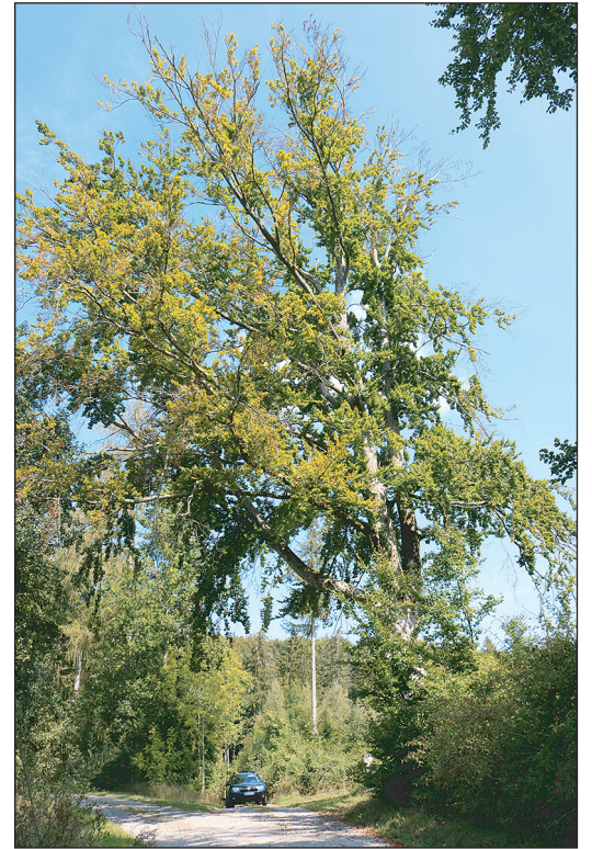
Dürreschäden beim Laubholz lassen sich nur im belaubten Zustand sicher erkennen. Diese Buche beginnt von der Krone her abzusterben. Wegen dem Wuchsort am Weg gilt es die Verkehrssicherung zu beachten.

Basierend auf der Abschätzung der Professur für Forstökonomie und Forstplanung zu den Klimafolgen und mehrerer Expertenworkshops auf den ausgewiesenen Demonstrationsflächen wird ein Behandlungskonzept erstellt, das Empfehlungen für waldbauliche Anpassungsmaßnahmen für die Stockausschlagwälder mit Objektschutzfunktion beschreibt. □