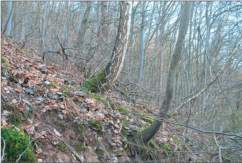
Säbelartig wachsende Bäume sind ein Indikator dafür, dass sich der Hang, auf dem sie wachsen, bewegt.

Zudem wurde eine Mindestgröße dieser Waldflächen von 1 ha festgelegt, alle kleineren Waldflächen wurden aus der Auswahl entfernt.