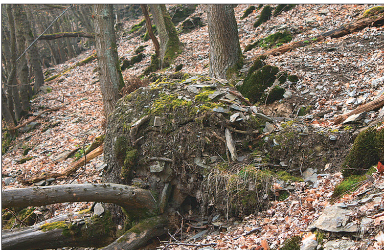
Umgefallene oder geworfene Bäume können mit ihrem Wurzelteller die Bodendecke öffnen und dadurch Auslöser von Bodenerosion oder Steinerschlag sein.

Im dritten Schritt wurden die von den Revierleitungen ausgewählten Stockausschlagwälder mit Hangschutzfunktion weiter typisiert und die Wälder an Hand ihrer Eigenschaften zu homogenen Gruppen - so genannten Straten - zusammengefasst. Straten beschreiben Flächen mit typischen, sich wiederholenden Waldzuständen und -zusammensetzungen auf ähnlichen Standorts- und Hangsituationen. Insgesamt konnten sieben Straten identifiziert werden. Aufgrund der großen flächenmäßigen Bedeutsamkeit wurde auf vier davon im Weiteren fokussiert.