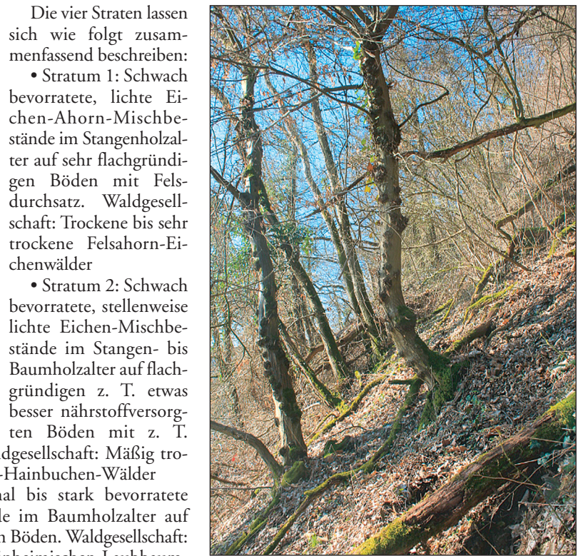
Die Bewirtschaftung von Stockausschlagwäldern mit Hangschutzfunktion erfordert viel waldbautechnisches Know-how. Der Klimawandel ist zusätzlich eine besondere Herausforderung. Der rechte Baum weist wiederum typischen Säbelwuchs auf.

Aus diesen Wäldern wurden dann typische Vertreter jedes Stratums ausgewählt, die im Projekt in mehrfacher Hinsicht genutzt wurden: • Hier wurden Parameter für das Wachstum der Bäume für die Simulationen der Professur für Forstökonomie und Forstplanung gewonnen. • An ihnen wurden beispielhafte Behandlungsmöglichkeiten in mehreren Expertenworkshops diskutiert und analysiert. • Auf ihnen werden im Frühjahr 2021 Demonstrationsflächen angelegt, auf denen Maßnahmen aus dem Handlungsleitfaden umgesetzt und evaluiert werden. Direkt neben den Demonstrationsflächen werden unbehandelte Monitoringflächen angelegt. Diese bleiben unbewirtschaftet und dienen als Referenzflächen.